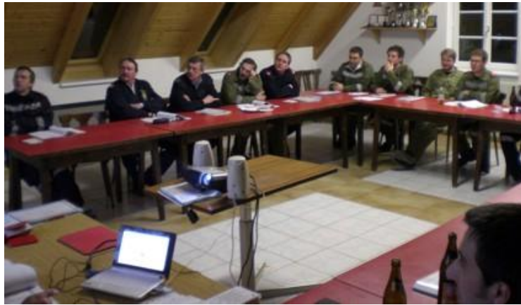
theoretische Ausbildung „Aufgaben des Maschinisten“

Am 26. und 28. März 2009 fand im Feuerwehrhaus in Stift Zwettl ein Einsatzmaschinistenkurs des Abschnittes Zwettl statt. 8 Kameraden aus Großweißbach nahmen ebenfalls daran teil.