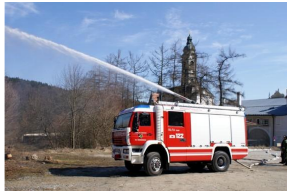
praktische Ausbildung zum Maschinisten